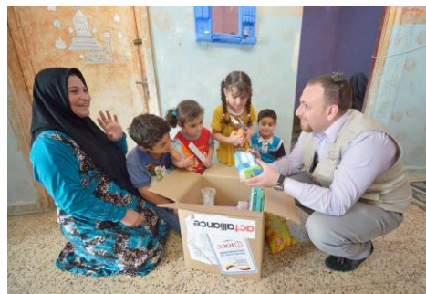
Een gezin ontvangt een pakket

Dit project zet ook aan tot bezinning. Een vraag die al snel opkomt: Wat is de positie van kerken in het Midden-Oosten, de bakermat van het christendom? Hoe is het om kerk te zijn in een minderheidspositie? Naast praktische hulp en collecten gaat de projectgroep hier ook mee aan de slag.