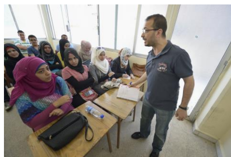
Onderwijs aan vluchtelingen

Onder deze vluchtelingen zijn christenen. Hoe kunnen en willen zij kerk-zijn in onze stad? Zijn contacten met onze kerken gewenst? Zo ja, hoe brengen we die tot stand en welke invulling geven we er dan aan?