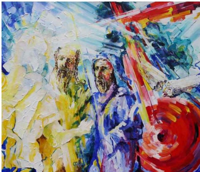
'Transfiguratie', door Kees Aalbers, acryl op doek, 2008.

De compositie is zodanig dichtbij gekozen dat de toeschouwer zich betrokken voelt bij het gebeuren en als het ware met de ogen van de apostelen Petrus, Johannes en Jakobus kijkt.