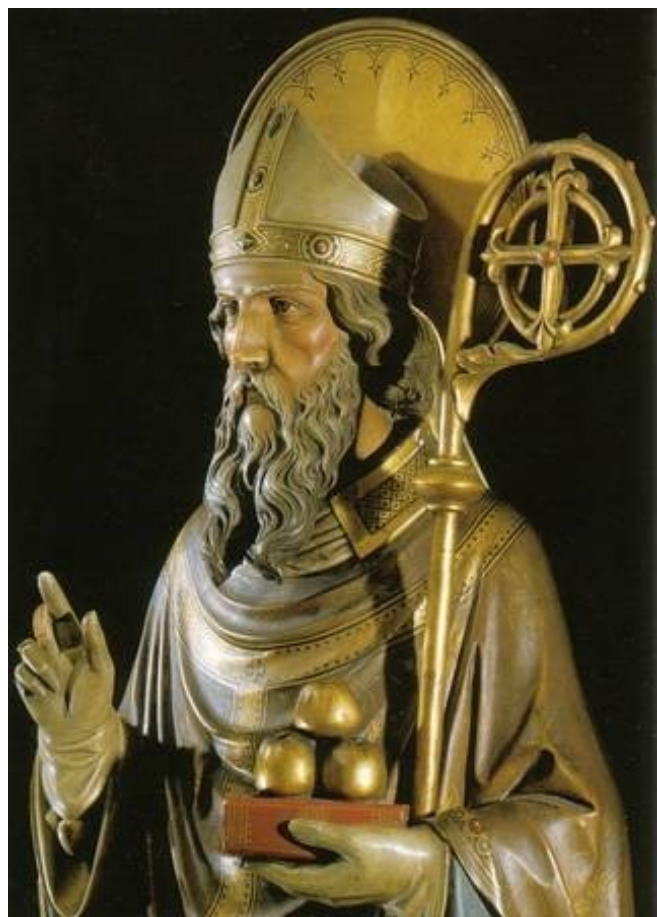
De heilige Nicolaas (19 e eeuw) in Ons' lieve Heer op Solder