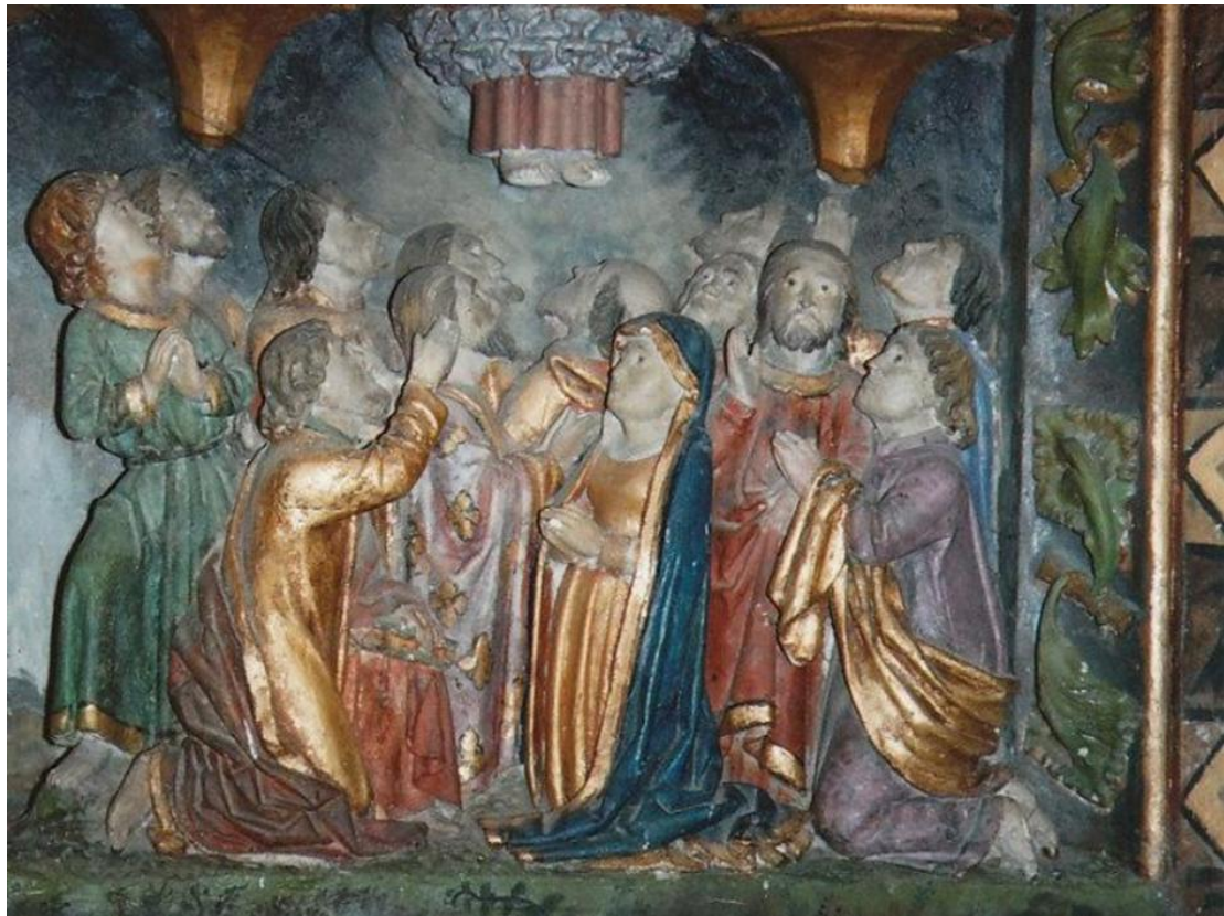
Hemelvaart, steenrelief (1516) op het altaar van Notre Dame de la Houssaye (O.L.V. van het Struikgewas), Pontivy, Frankrijk